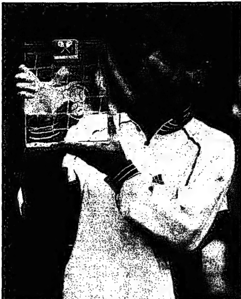
وفازت النجمة المصغرة غراف بالكأس